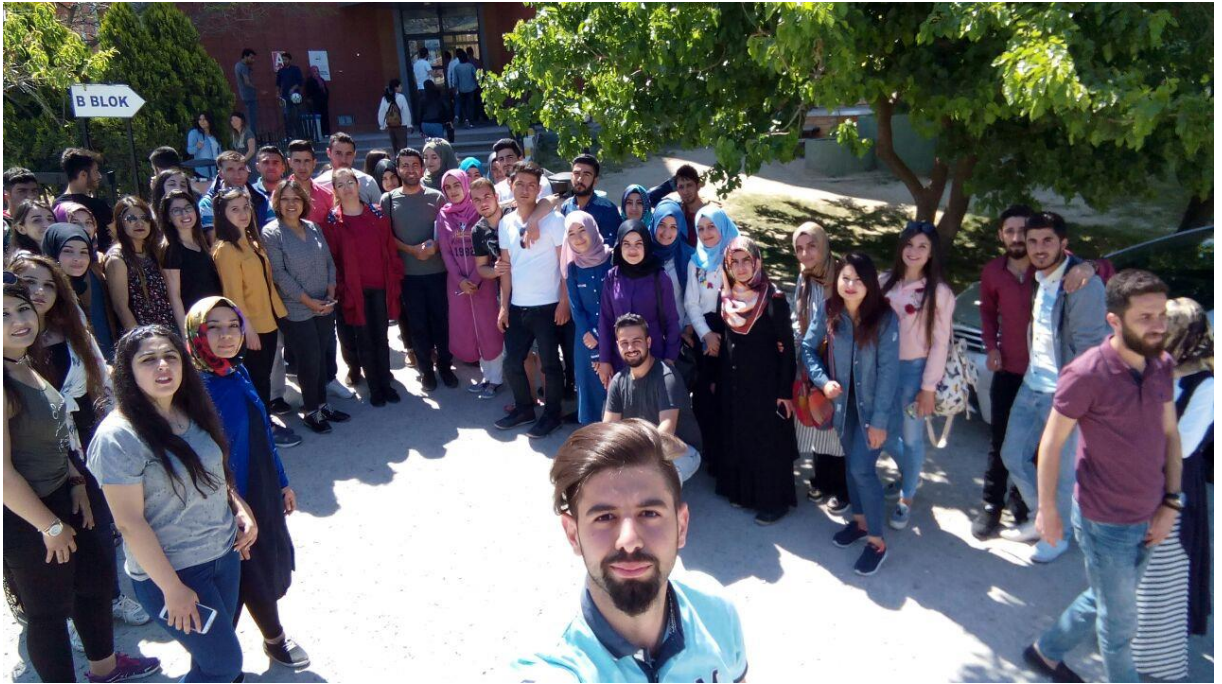
Çanakkale 18 Mart Üniversitesi