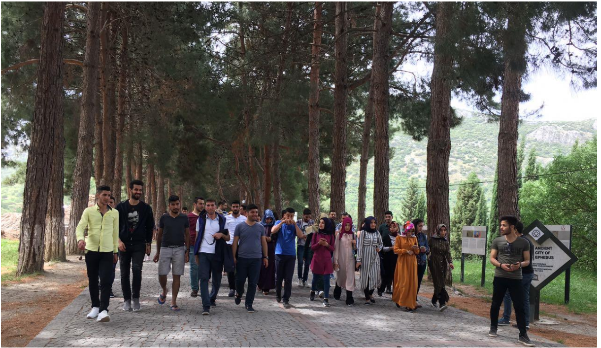
İzmir Efes Antik Kenti Çıkışı