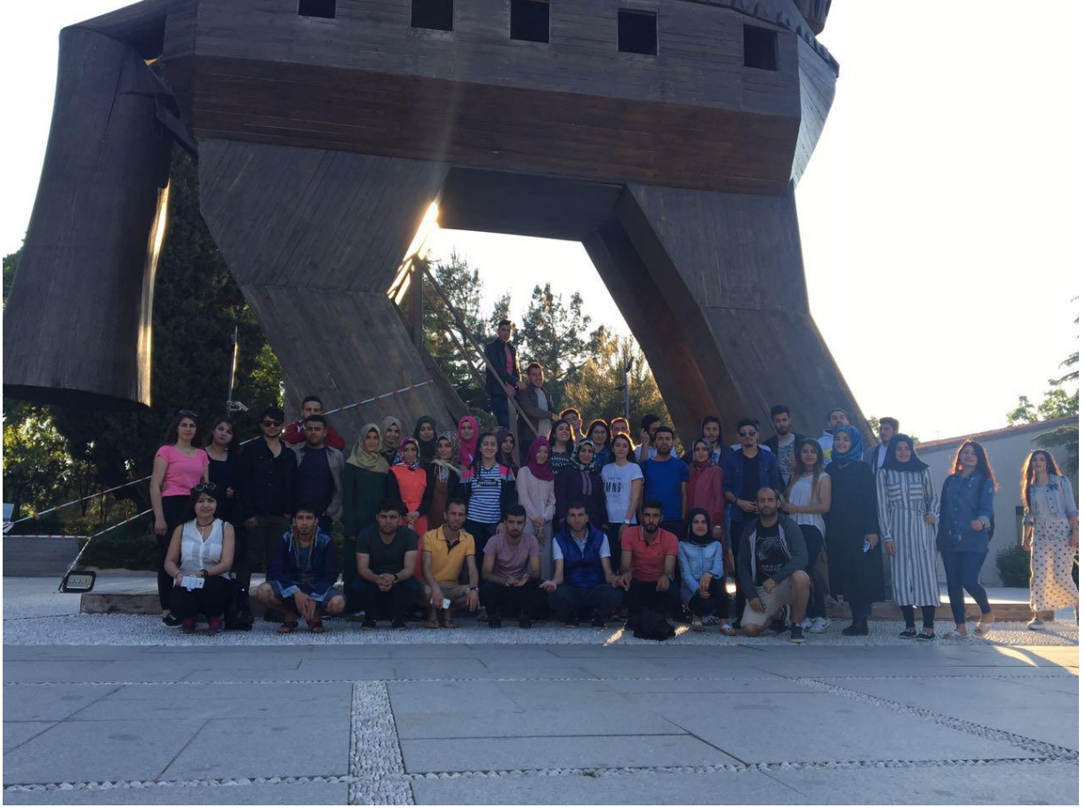
Antik Troya Kenti