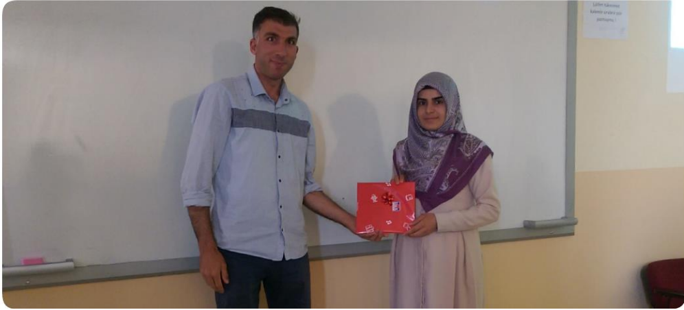
Fotoğraf Yarışmasını Kazanan Öğrencilere Hediyeilerinin Takdim Edilmesi