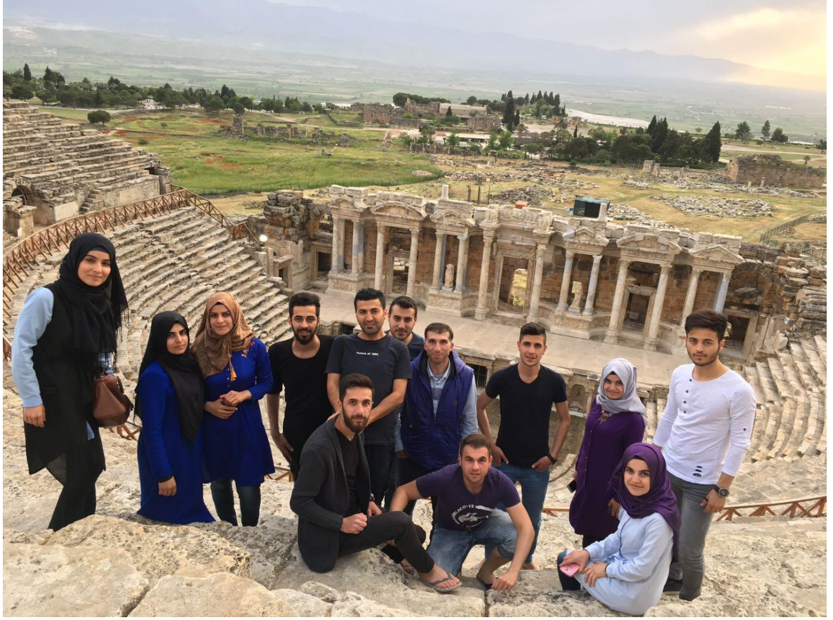
Hierapolis (Pamukkale) Antik Kenti