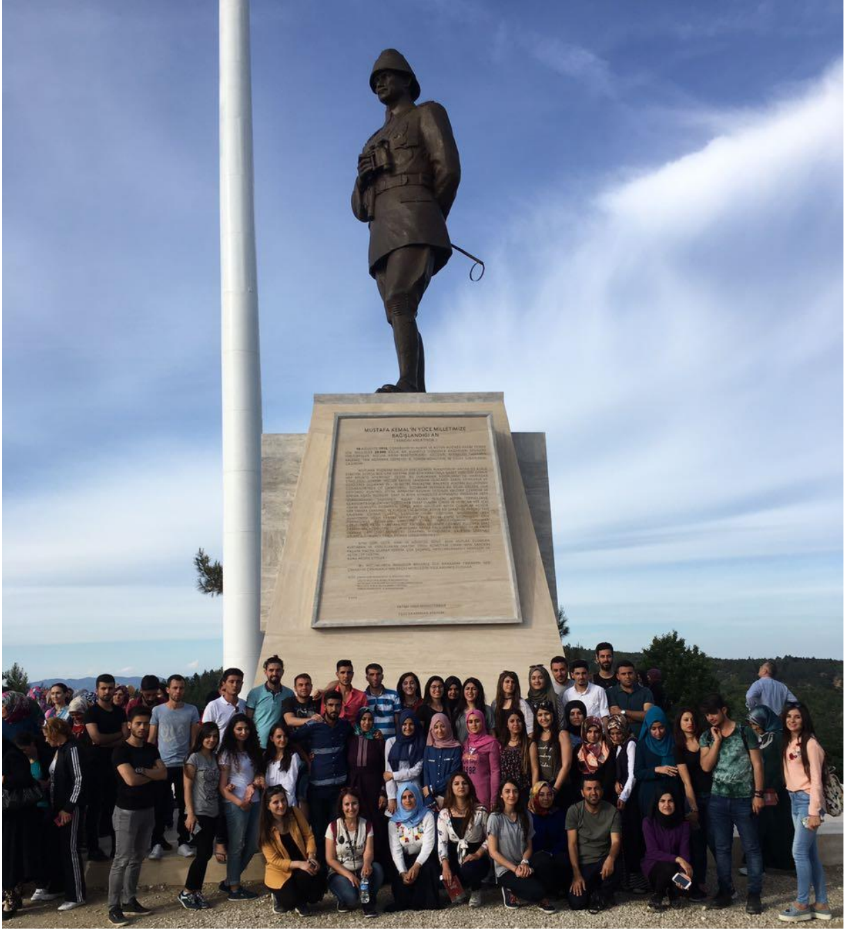
Conkbayırı (57. Alay) Şehitliği Anıtı