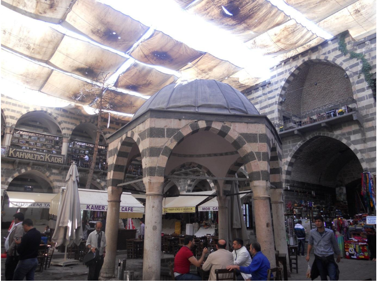
FOTO 17: DİYARBAKIR DAĞKAPI İLÇESİNDE YER ALAN TARİHİ TURİSTİK HASAN PAŞA PASAJI