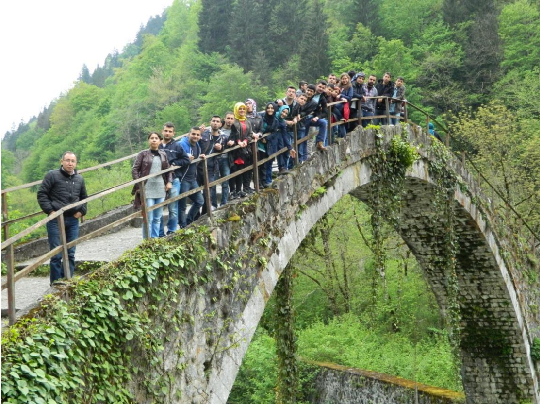
FOTO 6: DOĐU KARADENİZ ARAZİ ÇALIŞMASI EKİBİ OLARAK ÇEKİLMİŐ FOTOĐRAF