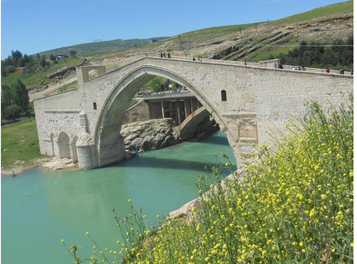
FOTO 18: 11.YY'DAN GÜNÜMÜZE TAŞMIŞ BİR AŞKIN ESERİ: MALABADI KÖPRÜSÜ