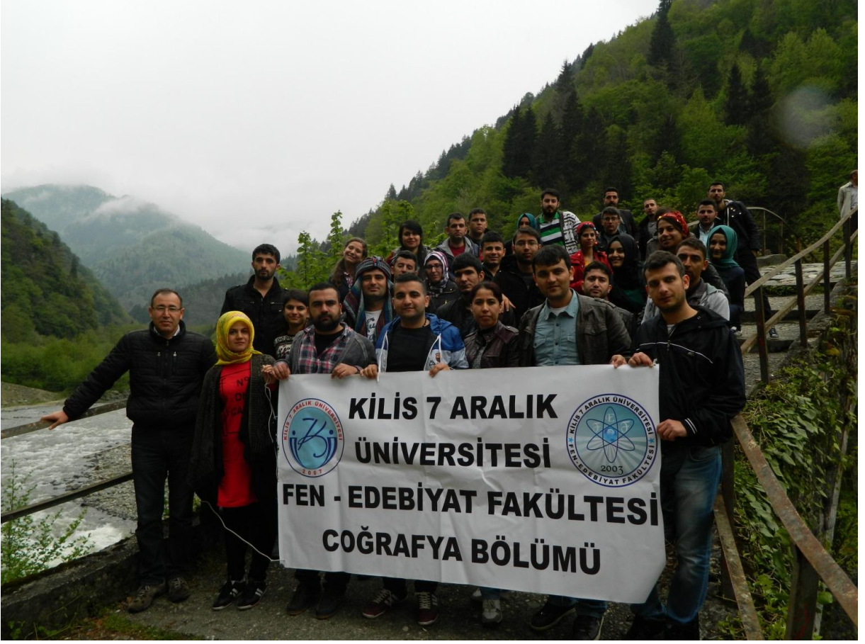
FOTO 1: DOĞU KARADENİZ GEZİSİNİ DÜZENLEYEN HOCALAR VE KATILIM SAĞLAYAN ÖĞRENCİLERLE FOTOĞRAF

1-5 MAYIS TARİHLERİ ARASINDA DÜZENLENEN DOĞU KARADENİZ, DOĞU VE GÜNEY DOĞU ANADOLU BÖLGELERİNİ KAPSAYAN ARAZİ ÇALIŞMAMIZDAN FOTOĞRAFLAR.