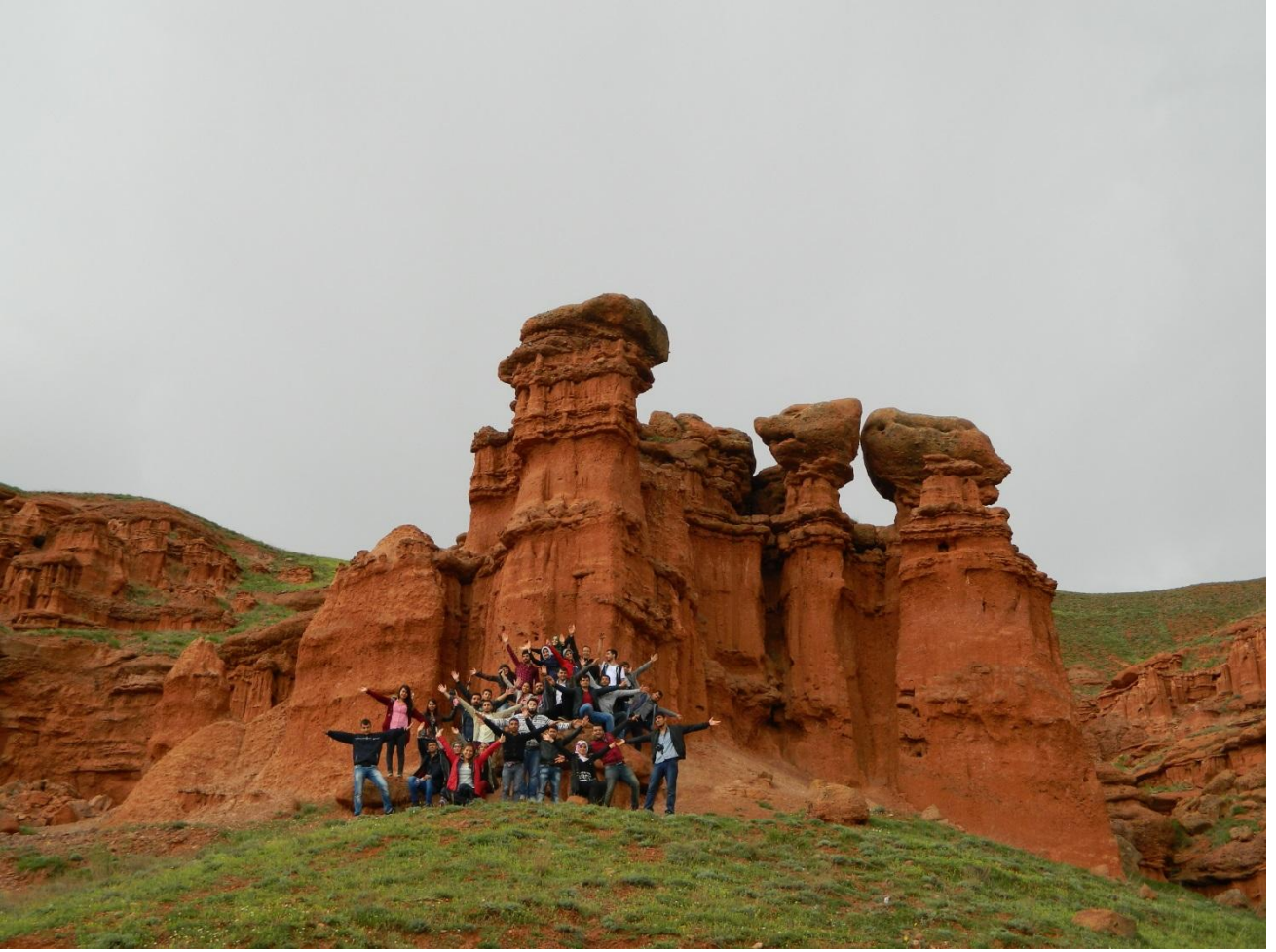
FOTO 13: ERZURUMUN NARMAN İLÇESİ SINIRLARI İÇERİSİNDE YER ALAN PERİLİKAYA VADİSİ